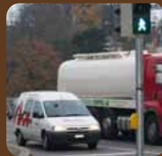
Motorisierter Individualverkehr (MIV)