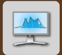
Verkehrssituation in Echtzeit