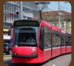
Öffentlicher Verkehr (ÖV)